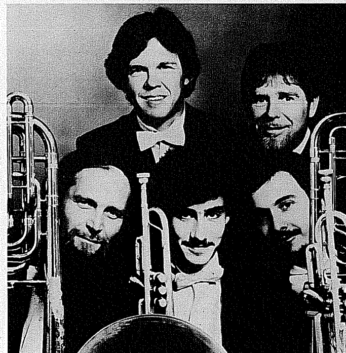
Annapolis Brass Quintet